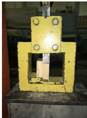
Figura 3: Montaje para ensayo de cizalle a través del adhesivo. (Acuña y Cofré 2018).

El montaje de la probeta de ensayo se muestra en la Figura 3; se emplea un equipo calibrado para aplicar una fuerza de compresión sobre una de las piezas de madera que conforman la probeta de tal manera de generar tensiones de cizalle en la zona encolada y así determinar la resistencia de la línea de encolado ante esta sollicitación.